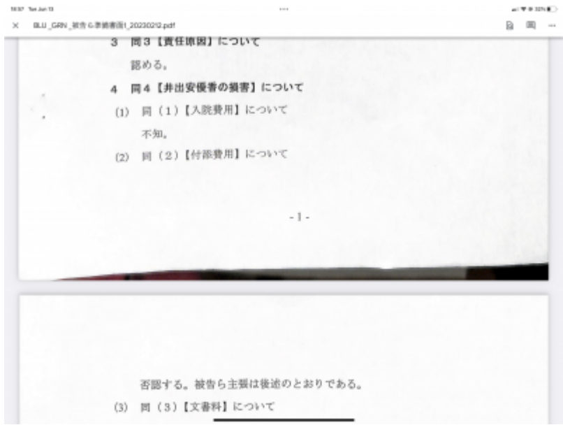
入院費は認めない